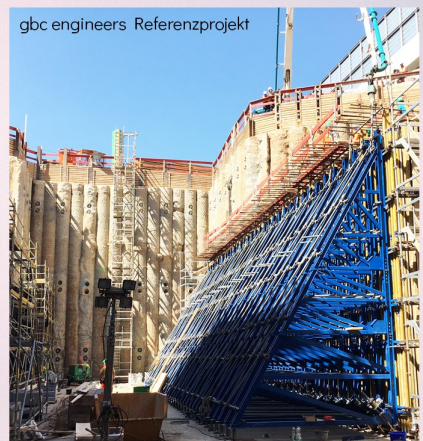
gbc engineers Referenzprojekt