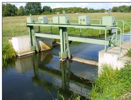
Einlaufwehr im Königsgraben