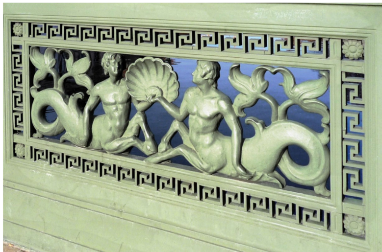
Eines der Hauptfelder des Geländers der Schlossbrücke in Berlin-Mitte, Detail des Geländers nach Entwurf von Karl Friedrich Schinkel (1781-1841).

verheirateten Schinkel all dies wird hier unverblümt angedeutet, doch für Beuth stellt dies alles im Unterschied zu den Narrativen in Kleve keine Gefahr mehr dar. Der gefühlte oder auch reale Zwang zur Abspaltung bestand nicht mehr in dem Maß, zumal auch der Beziehungspartner höchst angesehen und integriert ist, so dass durch diesen Sachverhalt gleichfalls eine gesellschaftliche Absicherung gegeben war. Motive der Homosexualität, der Androgynität, des Hermaphroditischen griff Schinkel ebenso höchst offensiv bei der Gestaltung des Brückengeländers der Schlossbrücke auf.