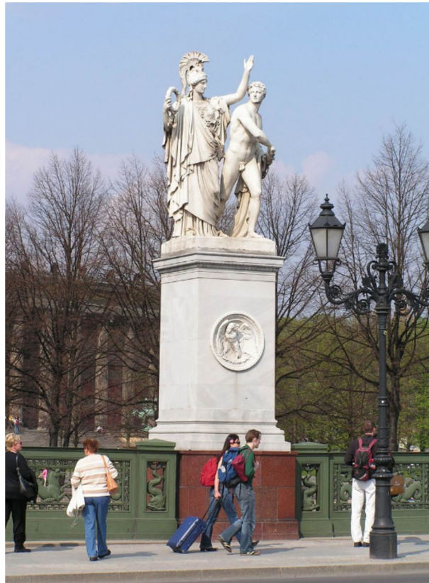
Berliner Schlossbrücke, Figur nach Entwürfen Schinkels

Eines der Hauptfelder des Geländers der Schlossbrücke in Berlin-Mitte, Detail des Geländers nach Entwurf von Karl Friedrich Schinkel (1781-1841).