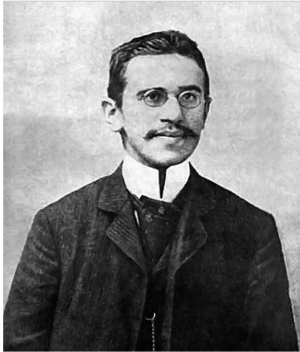
Hypothese vom „Fall Beuth“ als ein „Fall Weininger“ im Sinne Freuds

tiefen Depressionen waren nicht zuletzt seinem durch den Wiener Antisemitismus bedingten „jüdischen Selbsthass“ geschuldet.